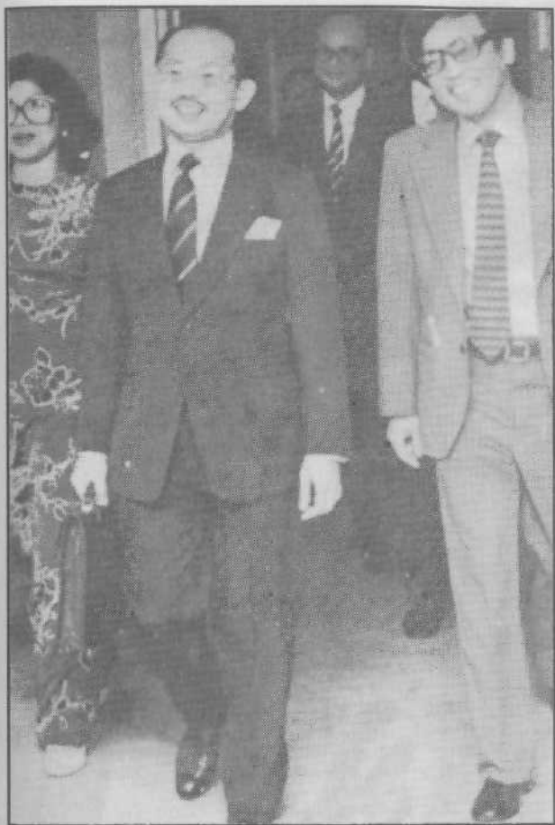
Beliau diiringi oleh teman-teman ke Dewan Rakyat untuk membentangkan Belanjawan Negara