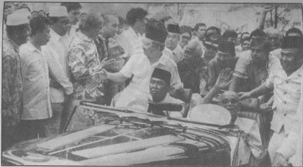
Tengku Razaleigh bersama Tunku Abdul Rahman turut mengiringi Datok Shahrir Samad dalam pilihanraya kecil Johor Bharu 26 Ogos 1988