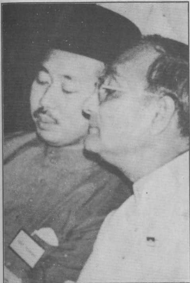
Bellau sedang menerangkan sesuatu kepada Dato' Husein Onn