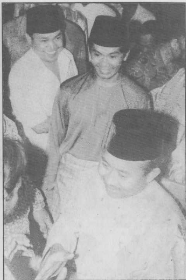
Sentiasa tersenyum walaupun dikritik hebat oleh pihak lawan