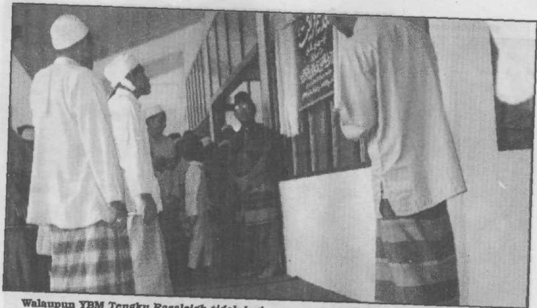
Walaupun YBM Tengku Razaleigh tidak lagi memegang jawatan dalam kabinet tetapi beliau terus diberi penghormatan oleh rakyat bagi merasmikan masjid Peringat dalam parlimen Nilam Puri