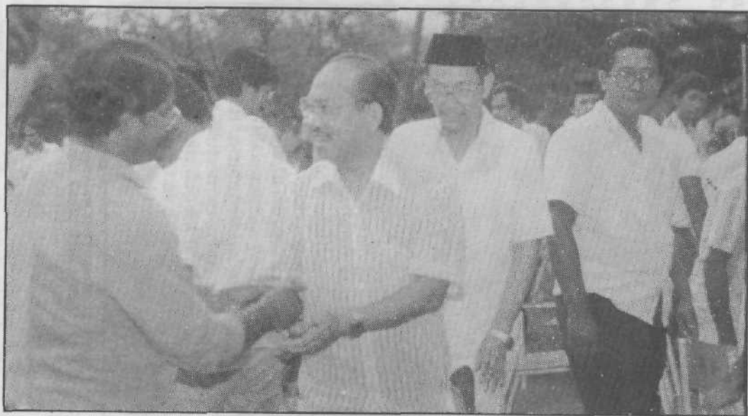
Kelihatan YBM Tengku Razaleigh sedang bersalaman dengan pengikut-pengikutnya di Johor