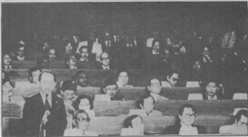
Sedang membantangkan Belanjawan Negara