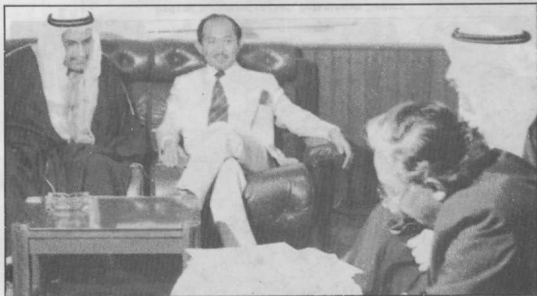
Beliau melayani teramunya dari Negara Timur Tengah