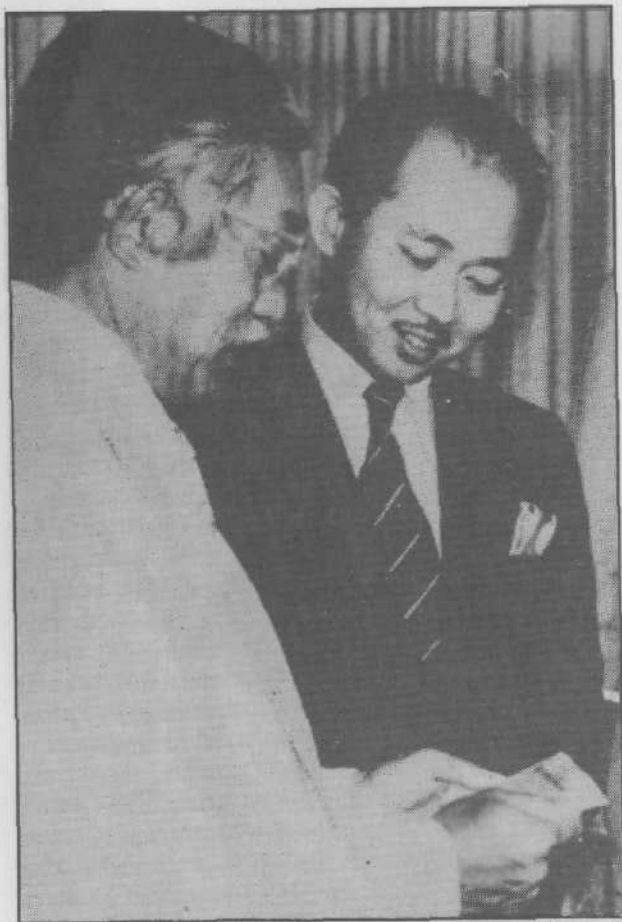
Dalam usaha yang sebegitu muda beliau mendapat kepercayaan daripada pemimpin - Kelihatan beliau bersama Allahyarham Tun Dr. Ismail