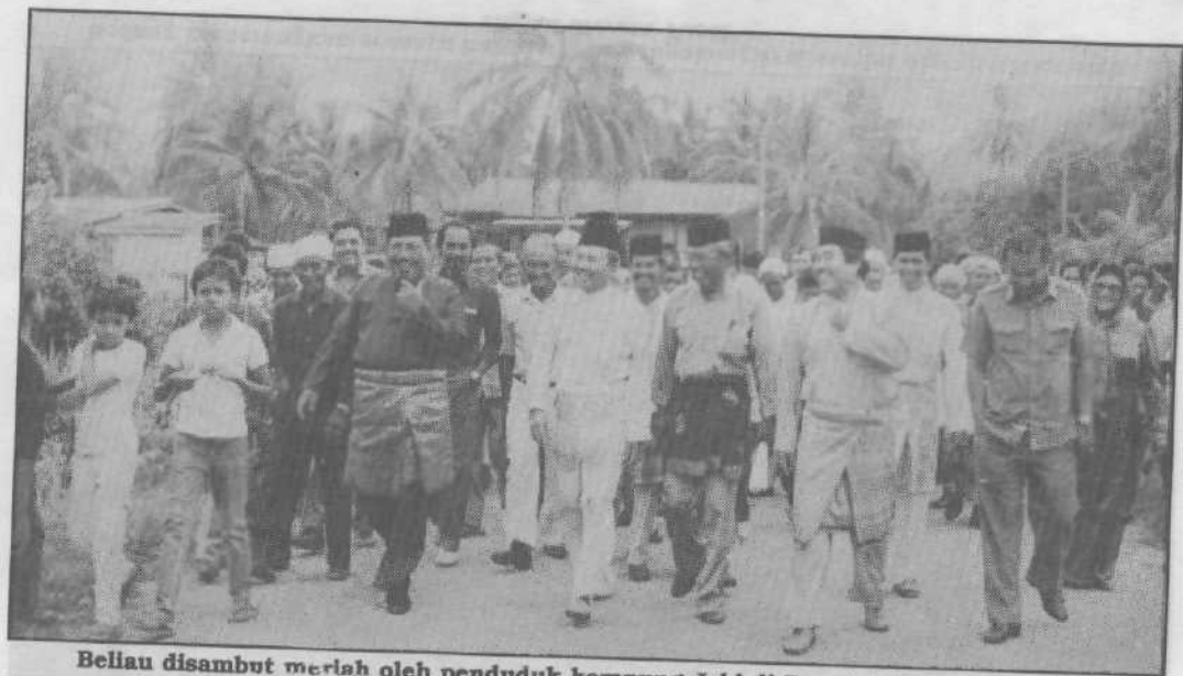
Bellau disambut meriah oleh penduduk kampung Jabi di Besut dalam sambutan Maulud Nabi