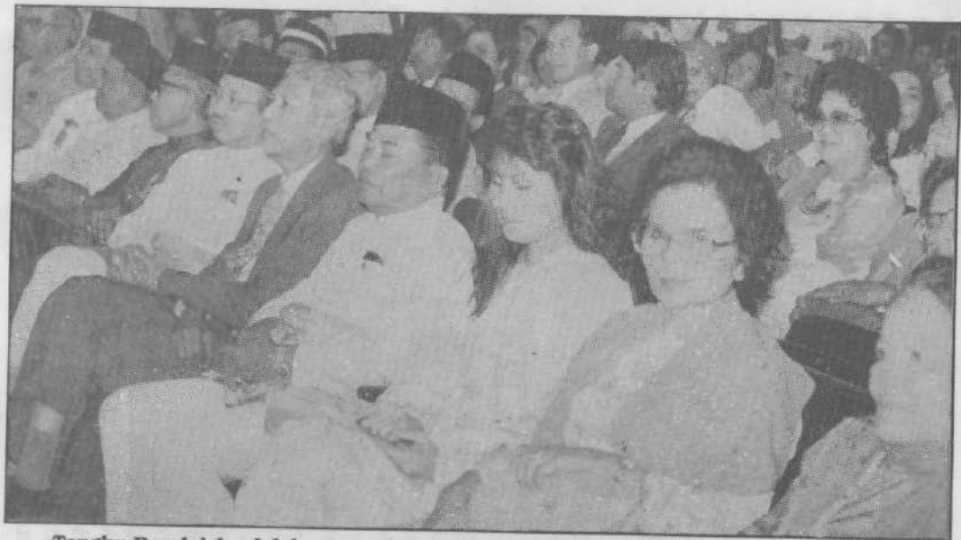
Tengku Razaleigh adalah merupakan tokoh yang pandai menyesuaikan diri dengan pemimpin lama dan baru asalkan sahaja pemimpin itu tahu menghormati dan menghargai orang lain.