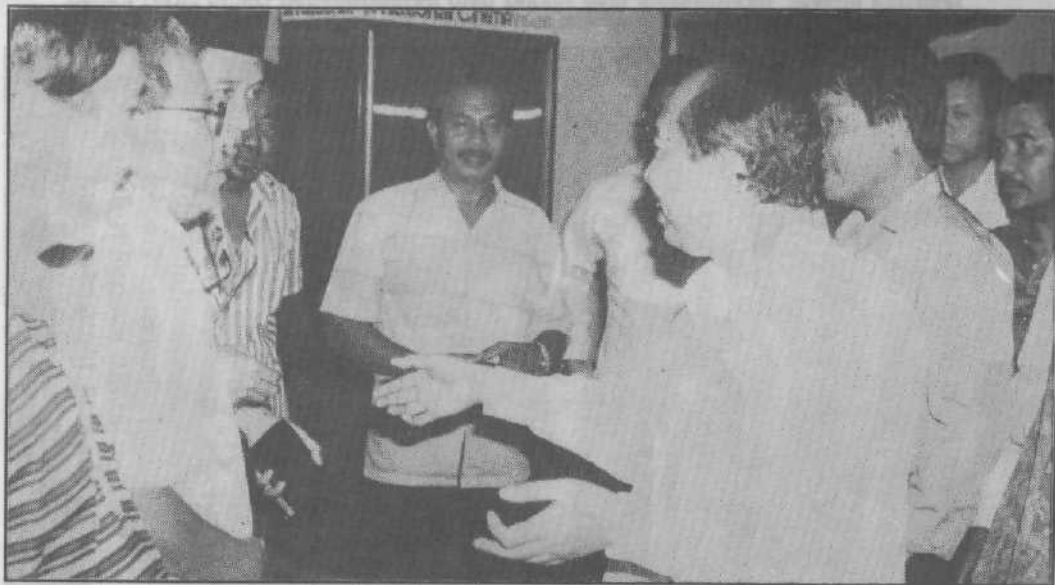
Sebagai pemimpin rakyat YBM Tengku Razaleigh Hamzah sentiasa mendampingi rakyat dan beramah mesera dengan mereka