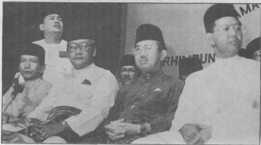
Bersama Barisan Semangat 46 dalam perjumpaan Hari Raya di sebuah hotel pada tahun 1988