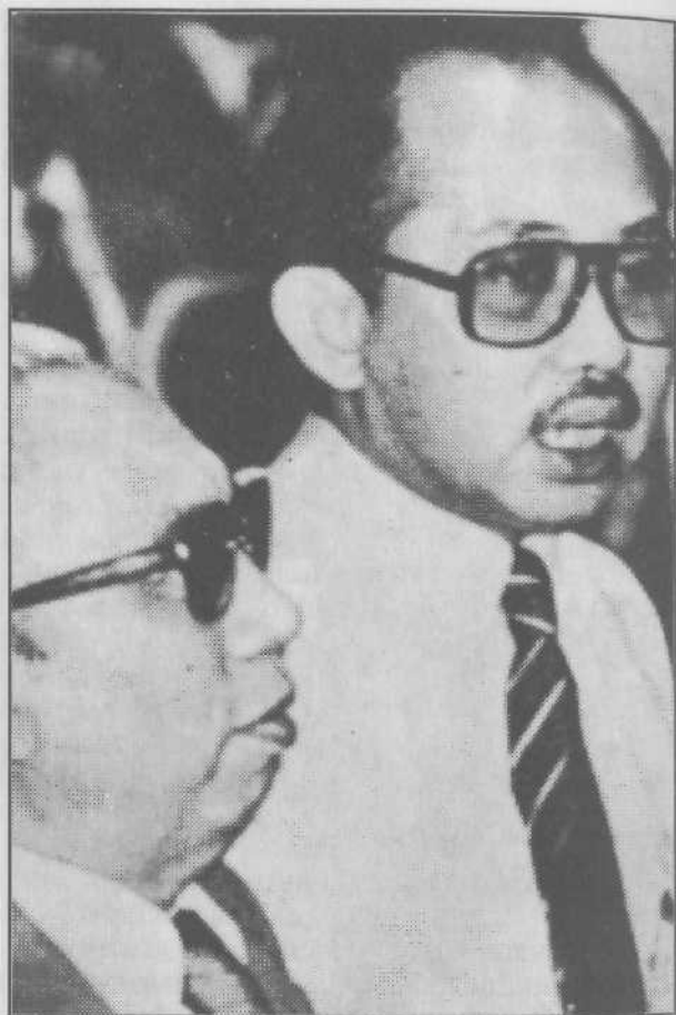
Beliau bersama Tun Adam Malik

Beliau bersama Tun Adam Malik dalam kunjungan ke Singapura. Beliau adalah Menteri Luar Negeri dan Ketua MPRS. Beliau juga pernah menjadi Menteri Pertahanan dan Menteri Dalam Negeri.